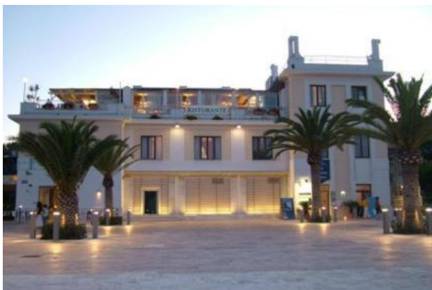
(KURSAAL - GROTTAMMARE)

IL NOSTRO AUGURIO È QUELLO DI INCONTRARCI A GROTTAMMARE E DIVENTARE AMICI