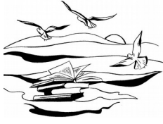
Biblioteca Comunale "Luca Orciari" Marzocca di Senigallia (AN)