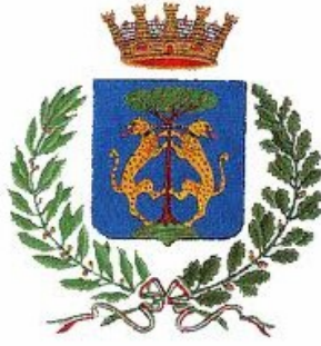
Comune di Senigallia